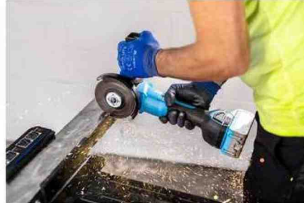
I nuovi elettoutensili prevedono una linea a batteria con motore brushless