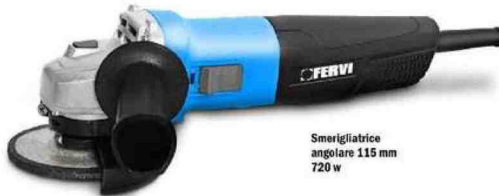
Smerigliatrice angolare 115 mm 720 w