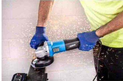
I nuovi elettoutensili prevedono una linea a filo alimentati a 230V