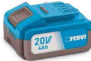
La linea a batteria su piattaforma F20VRange ruota attorno alle potenti batterie intercambiabili da 2Ah e 4Ah

Inoltre, il primo consolidamento della Rivit India PVT ha contribuito positivamente per 0,5 milioni di euro. I dati relativi al 30 giugno 2023 sono dati preconsuntivi gestionali e non sono, ad oggi, stati oggetto di revisione contabile. Come da calendario finanziario, il Consiglio di Amministrazione, tenutosi il 28 settembre 2023, ha approvato la relazione semestrale consolidata al 30 giugno 2023 sottoposta a revisione contabile limitata, che verrà pubblicata nei tempi e nei modi previsti dai regolamenti. Nel commentare l'andamento del Gruppo, Guido Greco, Amministratore Delegato del Gruppo, ha dichiarato: «Il Gruppo FERVI archivia il primo semestre del 2023 con un fatturato consolidato in linea