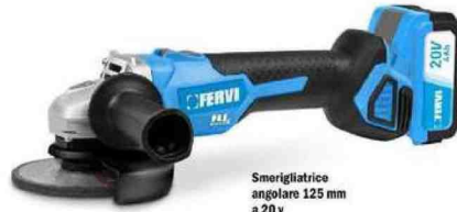
Smerigliatrice angolare 125 mm a 20 v