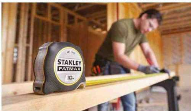
Stanley - il flessometro Fatmax Xtreme presenta diversi accorgimenti con cui soddisfa le esigenze di chi lo utilizza: la finestrella per il riallacciamento per il controllo del rientro del nastro, la stampa Recto verso molto comoda in caso di misurazioni "sopra la testa", il rivestimento addizionale del nastro in Blade Armor sui primi 16cm per aumentare la resistenza all'abrasione e il gancio extra large per una migliore presa sui materiali.