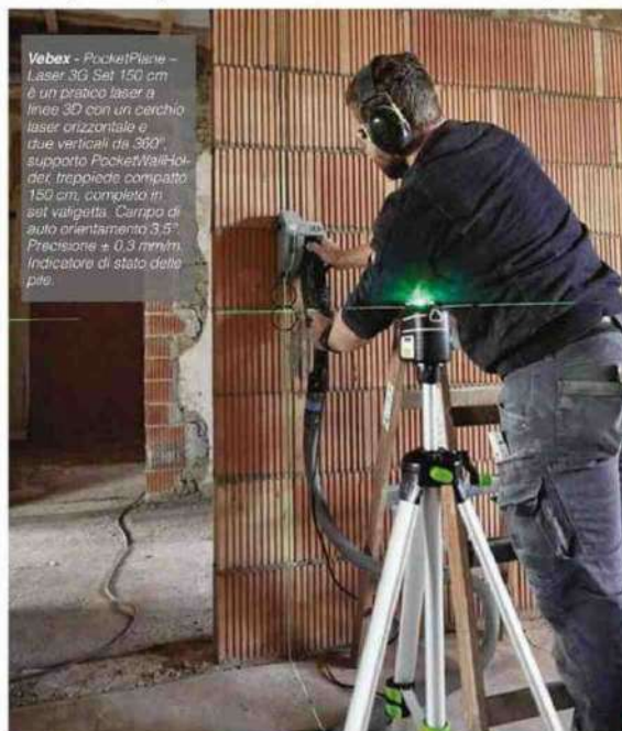
Vebex - PocketPlane - Laser 3G Set 150 cm è un pratico laser a linea 3D con un cerchio laser orizzontale e due verticali da 360°, supporto Pocket-Walk-Holder, treppiede compatto 150 cm, completo in set valigetta. Carro di auto orientamento 3.5". Precisione ± 0.3 mm/m. Indicatore di stato della pila.

Mette in campo il trend della sostenibilità Orlando Gardini Technical Promoter di Vebex che annuncia: "è già in atto un'esecuzione di una linea di prodotto ecosostenibile. Siamo inoltre sempre alla ricerca di nuovi prodotti, sia per ampliare la nostra gamma attuale che per individuare nuovi spazi in nuovi settori a noi adiacenti".