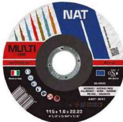
Nat Abrasivi - La linea MULTILINE, disponibile nelle misure 115x1,6mm e 125x1,6mm, ha un'ampia gamma di applicazioni: ferro, acciaio, acciaio inox, alluminio, ghisa, marmo, pietra e granito. Questo disco permette agli amanti del FaiDaTe, ma soprattutto agli artigiani, di non perdere tempo nel cambiare il disco a seconda del materiale da tagliare, ma di concentrarsi solo sul lavoro da svolgere, a regola d'arte.