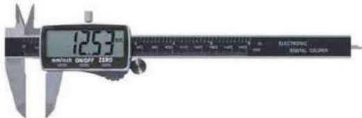
Fervi - Il calibro a Corsoio Digitale Elettronico Vogel Germany Art. 202011-3, in acciaio inossidabile, offre precisione e durata. Con un grande display LCD da 15 mm, semplifica la lettura delle misurazioni. Soddisfa le esigenze dei professionisti e degli hobbisti, è versatile e adatto all'uso su macchine industriali o per lavori di precisione a casa. La conversione tra millimetri e pollici e la funzione "zero" permettono misurazioni versatili e accurate.

Per rimanere al passo con le tendenze tecnologiche nel settore degli strumenti di misura, le aziende si concentrano sull'innovazione e sulla digitalizzazione. L'integrazione di funzioni come la connettività Bluetooth e USB consente di trasferire i dati delle misurazioni in tempo reale a dispositivi come smartphone