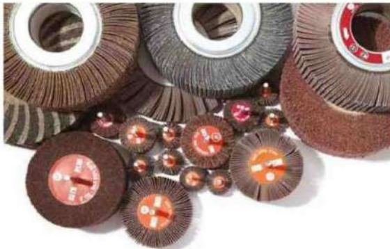
Cta Calflex - Prodotta dall'azienda, le ruote lamellari con gambo e loro sono disponibili in tela abrasiva in Ossido d'Alluminio, Zirconio, Ceramicato e Triact; in parno, Clean and Strip, T-Rect, Hi-Pro, Surface Conditioning, Cutting Polishing; miste tela/parno; frastagliate e spaziate. Grazie alla sua capacità produttiva è in grado di allestire utensili in migliaia di combinazioni diverse e anche di realizzarli su misura secondo le specifiche del cliente.