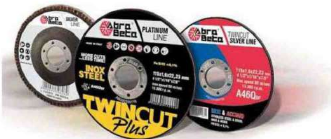
Abra Beta - Sono circa 1.500 i dischi abrasivi rigidi e flessibili presenti nel catalogo dell'azienda. Sono divisi in quattro famiglie, dalla più economica alla più performante: Smart, Silver, Platinum e Diamond.