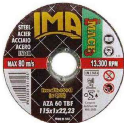
Ima Abrasivi - La linea di mole sottili IMach3 sviluppata per lavorazioni professionali su acciai di qualità è il disco ideale per applicazioni nelle quali è richiesto un taglio preciso e veloce, senza alterare le caratteristiche superficiali dei materiali. Tutti i prodotti della line Ima, Goio, IMach3 sono certificati OSA (Organization for the Safety of Abrasive).