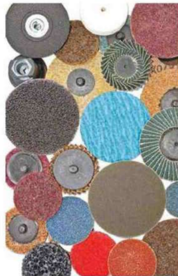
Rosver - La gamma di dischi a fissaggio rapido per operazioni di levigatura, sabbatura e finitura è disponibile in una vasta gamma di materiali abrasivi, come ossido di alluminio, zirconio e ceramica, garantendo prestazioni eccellenti su superfici piane e sagomate.